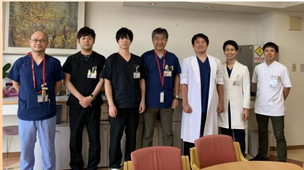
③ ⑤ ① ④ ②